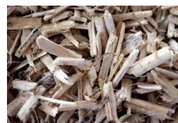
Paillettes de chanvre