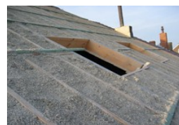
Le béton chaux-chanvre