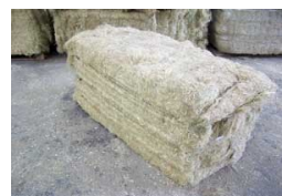
Balle de laine de chanvre.